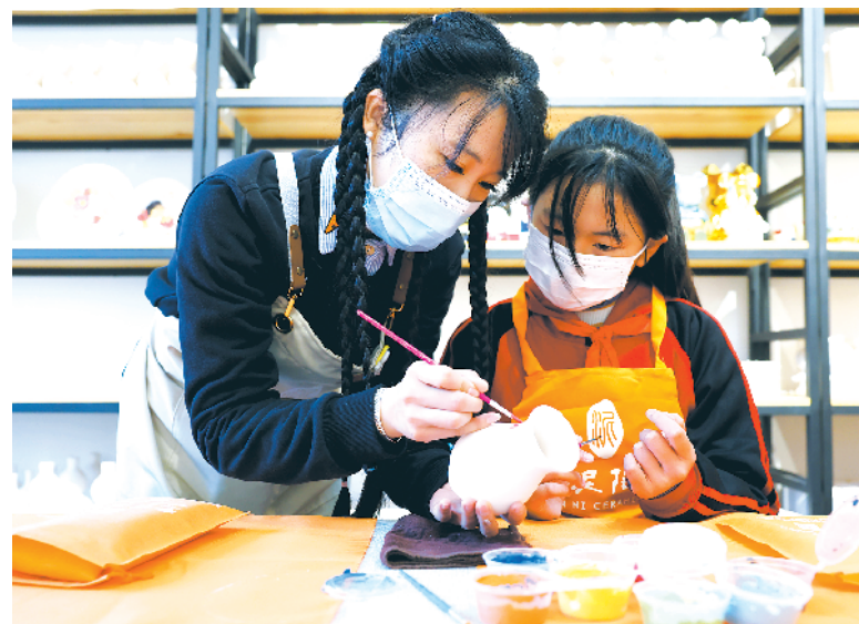
文旅助力乡村振兴

据了解,在产业帮扶上,“832平台”加强产销对接,激发乡村产业发展的内生动力,带动当地优势特色产业,积极推进“平台+政府”“平台+政府+企业”等产业帮扶模式。在仓配服务上,“832平台”在832个脱贫县以及预算单位较为集中的直辖市或省会城市,设立产销(销)地仓。截至目前,累计建设运营产销(销)地仓53家,仓储面积近30万平方米,服务供应商700余家。“832平台”是在财政部、农业农村部、国家乡村振兴局、中华全国供销合作总社四部门指导下,由中国供销电子商务有限公司建设和运营的脱贫地区农副产品网络销售平台。2020年1月1日上线运行以来,一直秉持帮扶属性、公益属性。