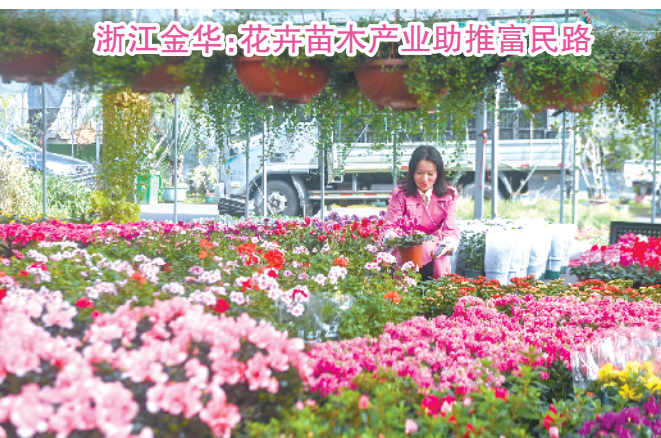
浙江金华:花卉苗木产业助推富民路