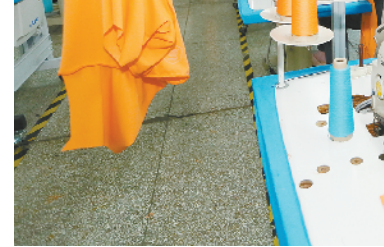
山东即墨:忙外贸 赶订单

活动期间,司法部、全国普法办将发布第九批全国“民主法治示范村(社区)”名单、第三批全国普法依法治理创新案例,第四批全国法治宣传教育基地,并在中国普法“一网两微一端”组织开展宪法知识竞答活动;全国各高铁列车和车站将播放宪法宣传片及优秀法治微视频作品。