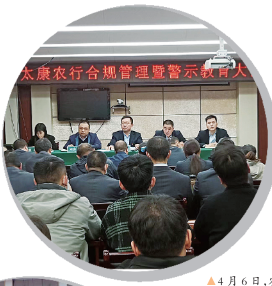
4月6日,农行太康支行召开合规管理暨警示教育大会,引导全行党员干部员工进一步提升合规意识,加强合规管理,牢固树立“我的合规我负责,别人的合规我有责”的合规理念。