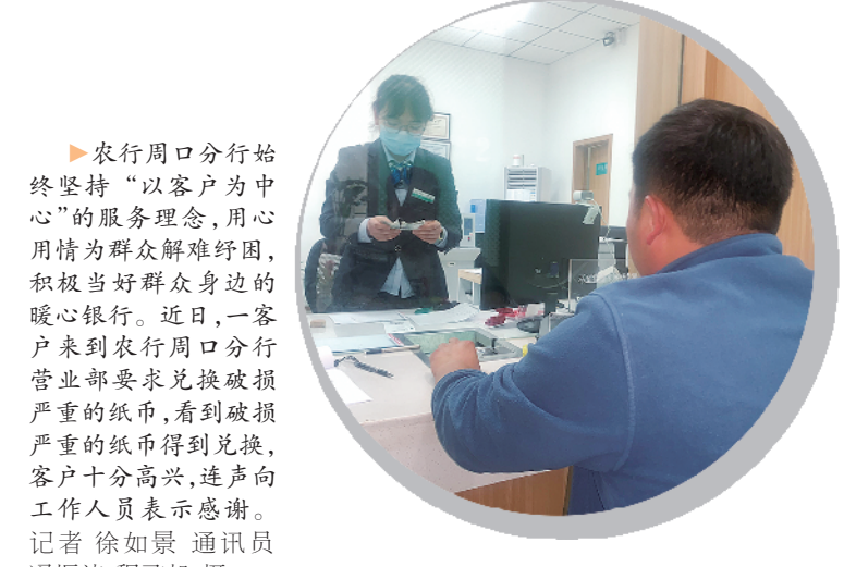
农行周口分行始终坚持“以客户为中心”的服务理念,用心用情为群众排忧解难,积极当好群众身边的暖心银行。近日,一客户来到农行周口分行营业部要求兑换破损严重的纸币,看到破损严重的纸币得到兑换,客户十分高兴,连声向工作人员表示感谢。