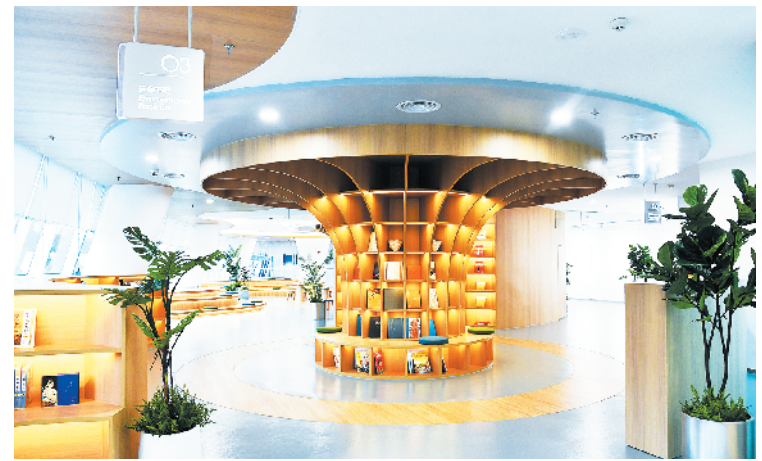
变垃圾焚烧厂为“网红打卡地”

8月14日,在赣州讯康电子科技有限公司,工作人员检查T1-T2全自动穿环机生产的元器件。江西省赣州市着力建设具有完整性、先进性、安全性的现代化产业体系,坚持把发展经济的着力点放在实体经济上,做优做强产业,推动产业高质量发展。目前,赣州已形成以高技术制造业、现代家居、有色金属和新材料等为主导的现代工业产业体系。