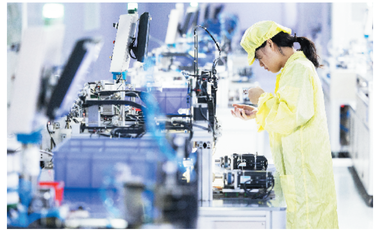
江西赣州:高技术制造业推进高质量发展

8月14日,在赣州讯康电子科技有限公司,工作人员检查T1-T2全自动穿环机生产的元器件。江西省赣州市着力建设具有完整性、先进性、安全性的现代化产业体系,坚持把发展经济的着力点放在实体经济上,做优做强产业,推动产业高质量发展。目前,赣州已形成以高技术制造业、现代家居、有色金属和新材料等为主导的现代工业产业体系。