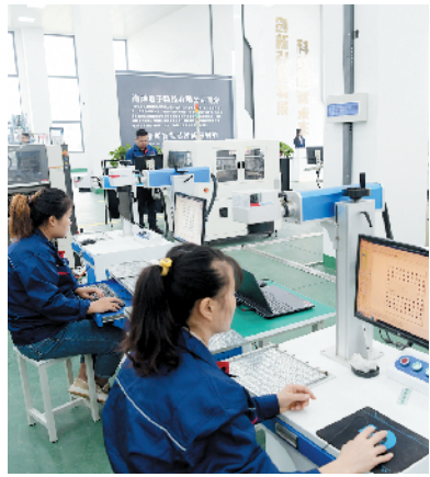
西华经开区电子产业园建设项目。