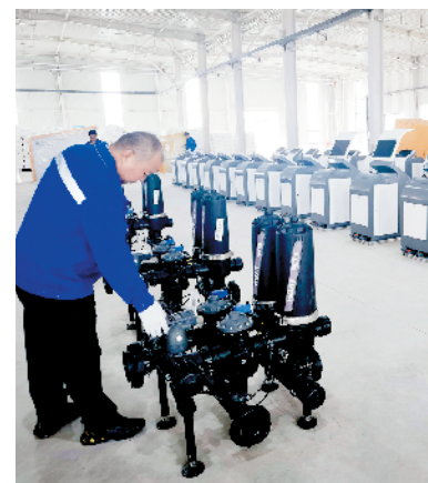
新疆天业塑料节水灌溉装备项目。