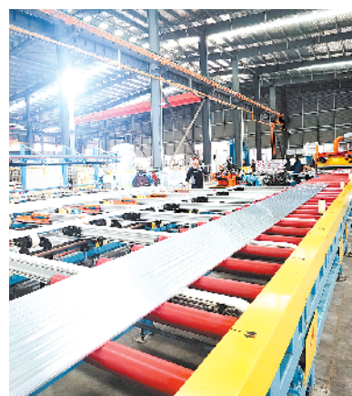
天子铝业光伏新能源材料及智能化改造生产项目。