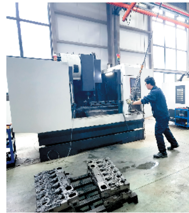
扶沟县智合年产8万只气缸盖、1万只缸体建设项目。