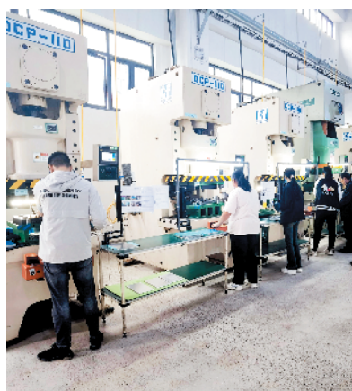
精泰电子科技智能终端及精密结构件生产项目。