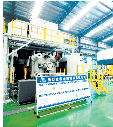
金泰铝制缸盖缸体及变速箱体产业园项目。