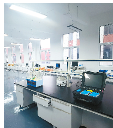
安必诺检验检测项目。