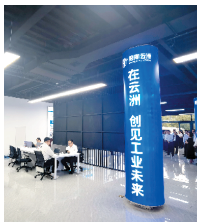
浪潮云洲工业互联网和数字认证中心项目。