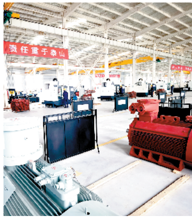
河南省承业电气年产80万千瓦防爆电机生产线建设项目。