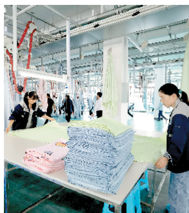
南通纺织科技产业园鸿业家纺100万件套家纺项目。