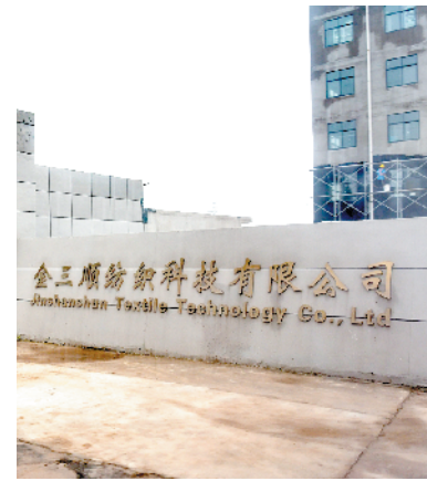
金三顺纺织服装辅料染整建设项目。