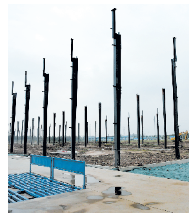
河南福淮年产2000台石英制品生产设备制造项目。