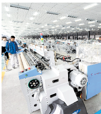
河南瑞驰纺织科技1000台智能织机项目。