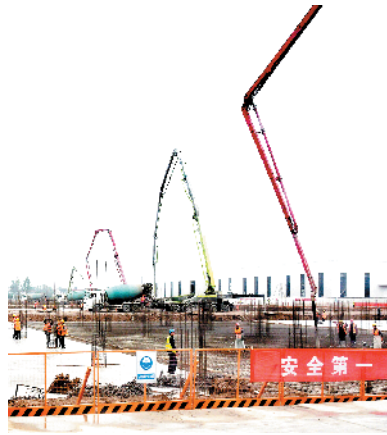
扬力集团年产2万套智能锻压设备建设项目。