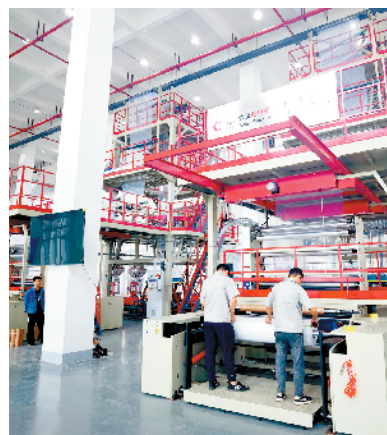
周口利星包装材料有限公司彩印包装项目。