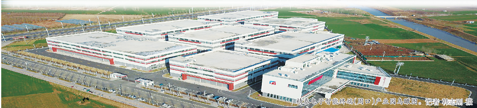
精英电子智能终端(周口)产业园鸟瞰图。