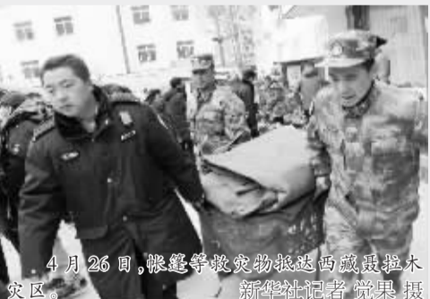
4月26日,救援队搜救被困尼泊尔地震灾区。