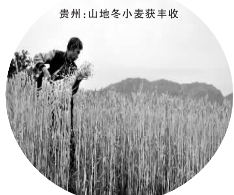
贵州:山地冬小麦丰收

新版《辞海》定位于“守正出新”。所谓“守正”,是指《辞海》要严格遵循辞书编纂规律,确保编纂质量。所谓“出新”是指紧跟时代步伐,利用互联网和大数据技术,吸收最新知识成果和最新发现,用富于时代气息的语言形式和技术手段大胆创新。