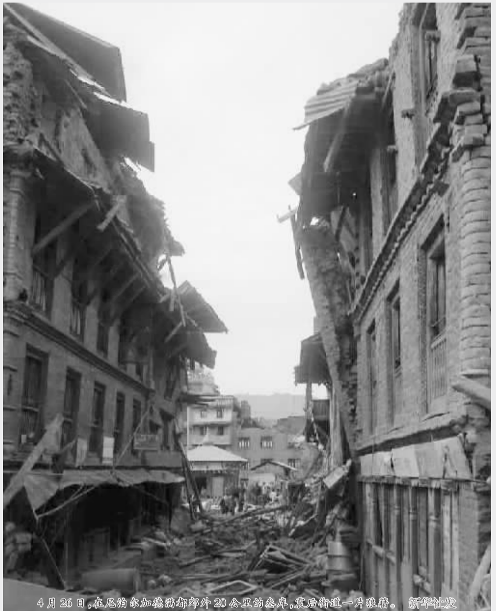
4月26日,在尼泊尔加德满都郊外20公里的农房,震后街巷一片狼藉。

西藏各级已紧急调集2.1万顶帐篷、2.3万套棉衣裤及食品、药品、饮用水等救灾物资,运往灾区,保证受灾群众的正常生活。同时,西藏相关部门还派出地震专家赶赴现场,加强监测预警,重点防范由于降雨降雪和强余震形成的山体滑坡、泥石流、滚石,避免造成新的人员伤亡。