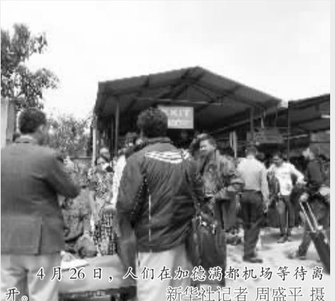
4月26日,人们在加德满都机场等待救援。