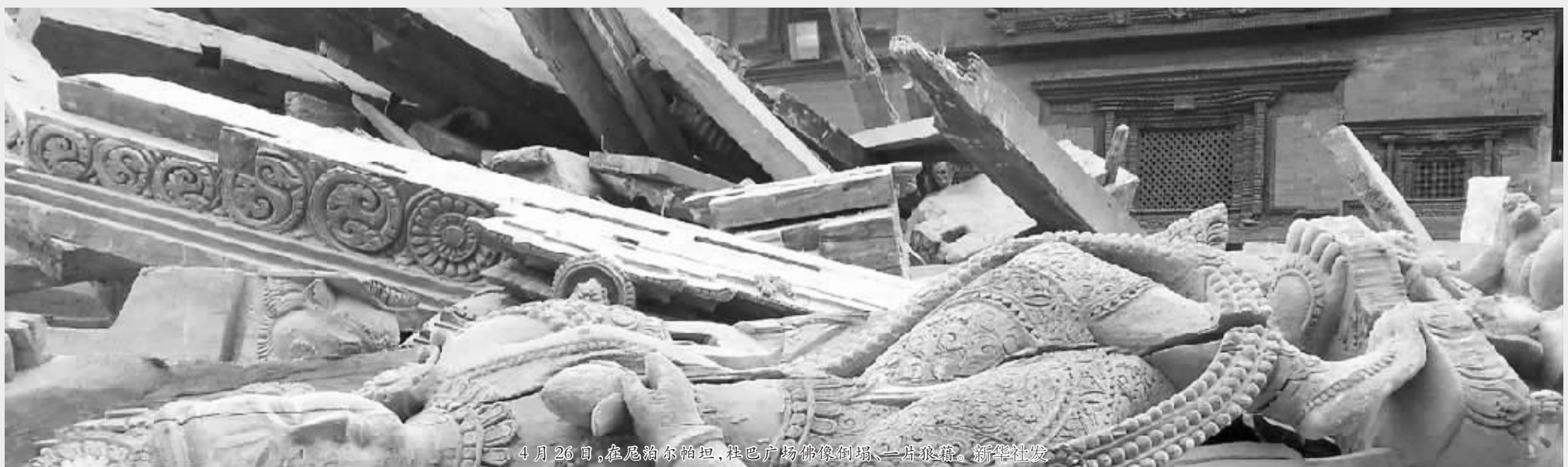
4月26日,在尼泊尔首都加德满都,鞋巴广场佛像倒塌,一片狼藉。