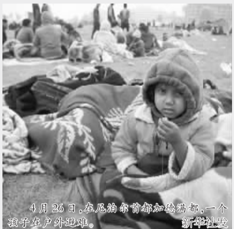
4月26日,在尼泊尔首都加德满都,一个孩子在户外避难。

中国国际救援队由62名搜救队员、医护人员、地震专家、技术保障人员组成,携带有搜救、医疗等有关救援设备和6条训练有素的搜救犬。据救援队领队、中国地震局震灾应急救援司司长赵明介绍,救援队大部分队员参加过汶川、玉树、芦山及日本、海地、巴基斯坦等多次国内外地震救援,具有丰富的救援经验。