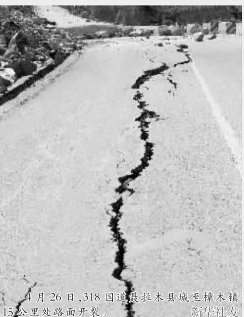
4月26日,318国道震拉木县城至樟木镇15公里处路面开裂。